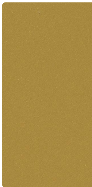
4201E13343L3F Glory Curry