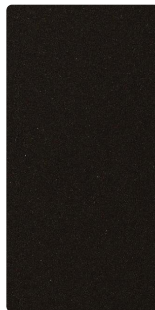
4201E82368L3F Intense Umber