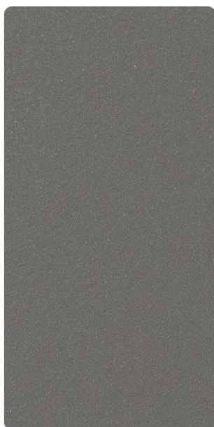
4201E75307L3F Radiant Silver