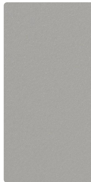
4201E75281L3F Grey Cloud