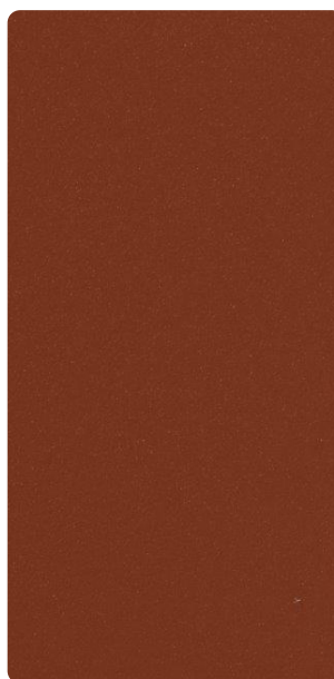
4201A82834L10 L'Ocre Rouge