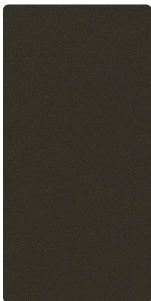
4201E75918L3F Steep Roof