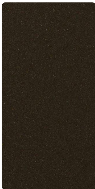
4201E82291L3F Walnut Wood