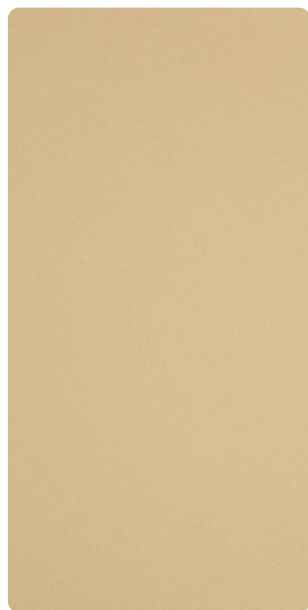
5907U13686S10 Horn Brass