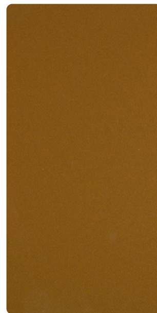
5903U83453S10 Modern Bronze