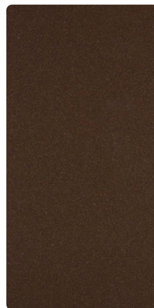
591TU85576R10 Textured Bronze