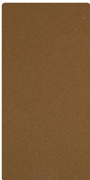
5903U83638S10 Celtic Alloy