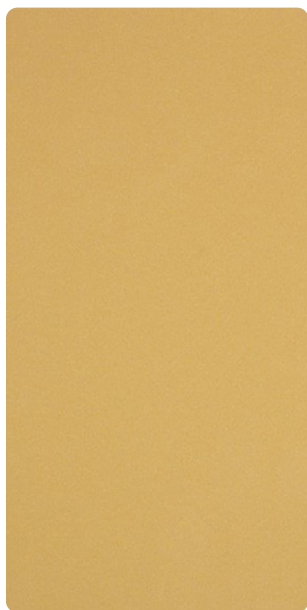
5903U13688S10 Golden Brass

PL Powierzchnie odporne na działanie warunków atmosferycznych z olśniewającymi efektami