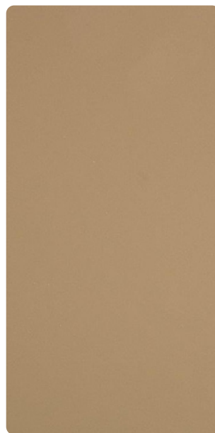
5903U83372S10 Jurassic Sediment