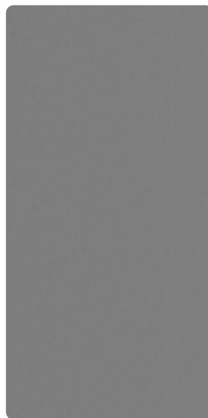
5703E78171F30 Brushed Steel