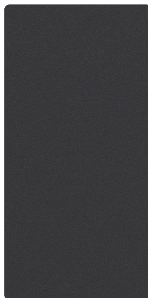
5703E78649F30 Blued Steel