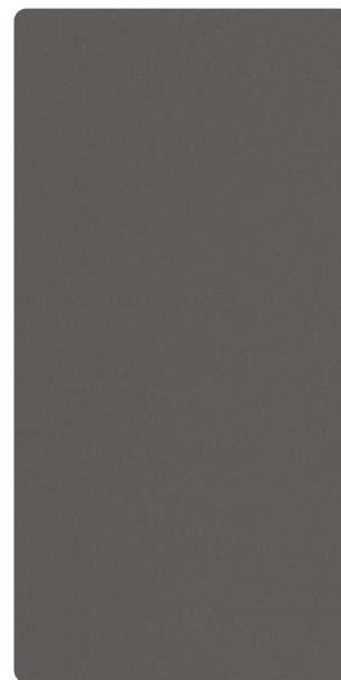
5703E78363F30 Aged Silver