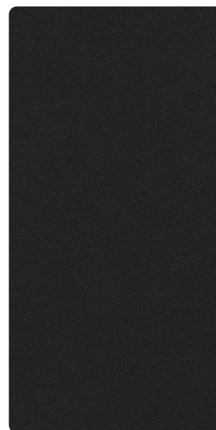
5703E71387F30 Dark Ore